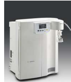
Production Eau Ultrapure