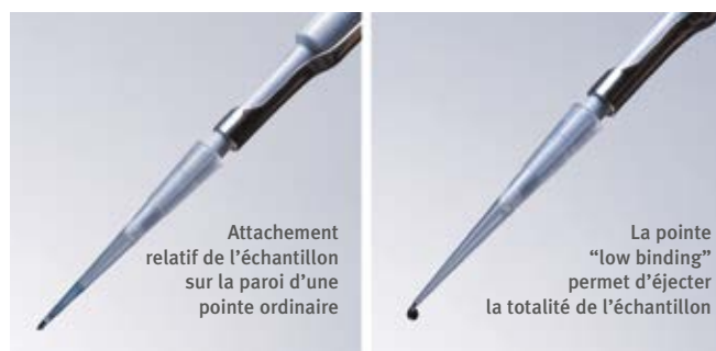
Attachement relatif de l'échantillon sur la paroi d'une pointe ordinaire